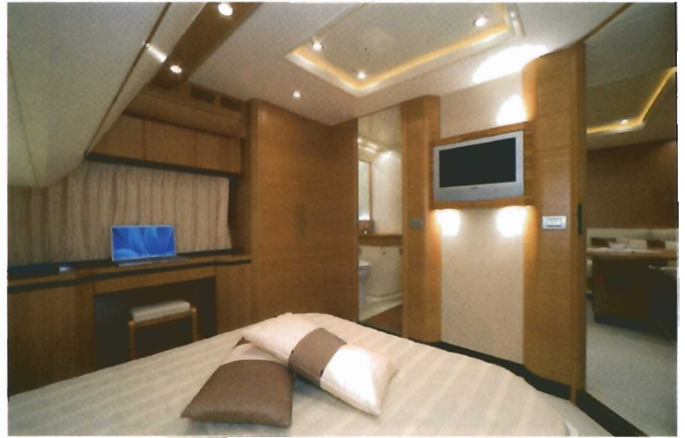
Cada camarote dispone de su propia pantalla de TV y de su baño privado.