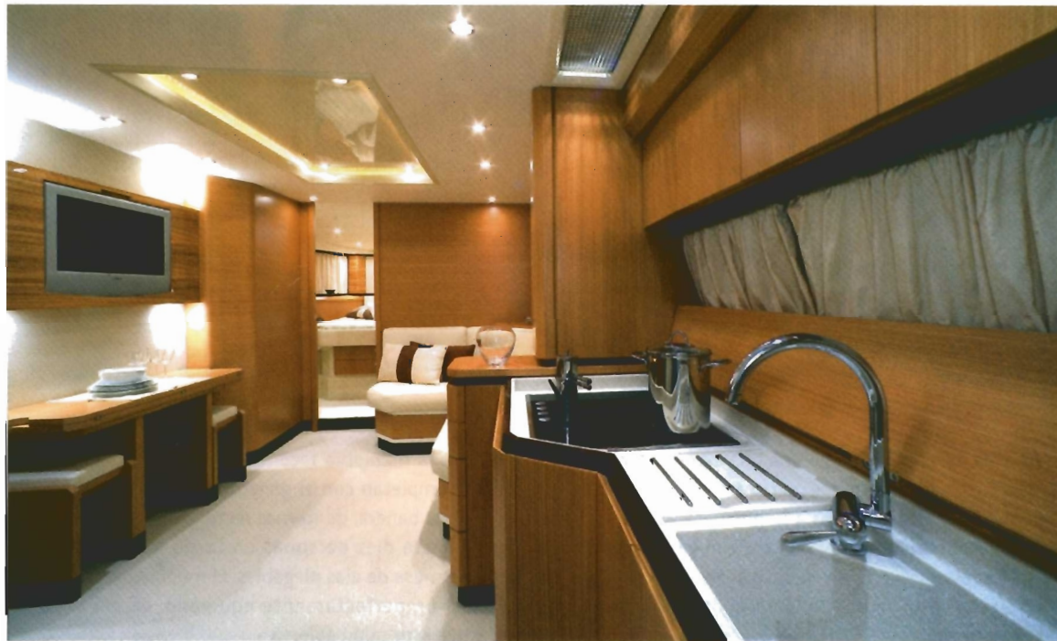
La cocina, situada a estribor, se integra perfectamente en el espacio principal sin estorbar el paso.

ra la navegación. Ubicada en la banda de babor, la amplia consola deja espacio para colocar dos pantallas multifunción que permitirán visualizar todos los parámetros del barco. Los indicadores de los motores dependen de otras dos pantallas de Man que muestran las lecturas en modo analógico o digital con un interminable número de datos sobre las máquinas. Las palancas electrónicas sincroniza-