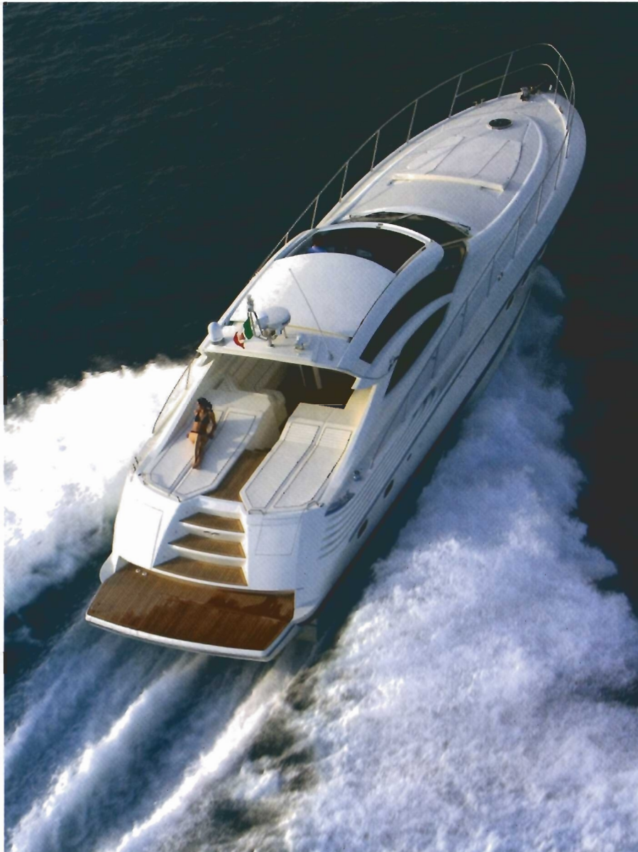
La Sarnico 60, una de las mejores expresiones en su segmento, alcanza los 35-39 nudos de máxima en función de la potencia elegida