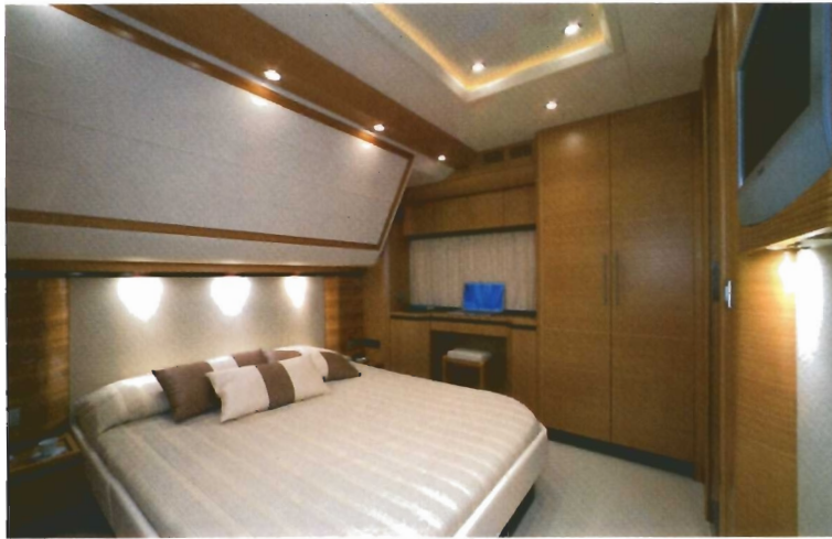
A media eslora, el camarote de armador consagra el concepto del astillero de no distribuir nunca dos cabinas contiguas.