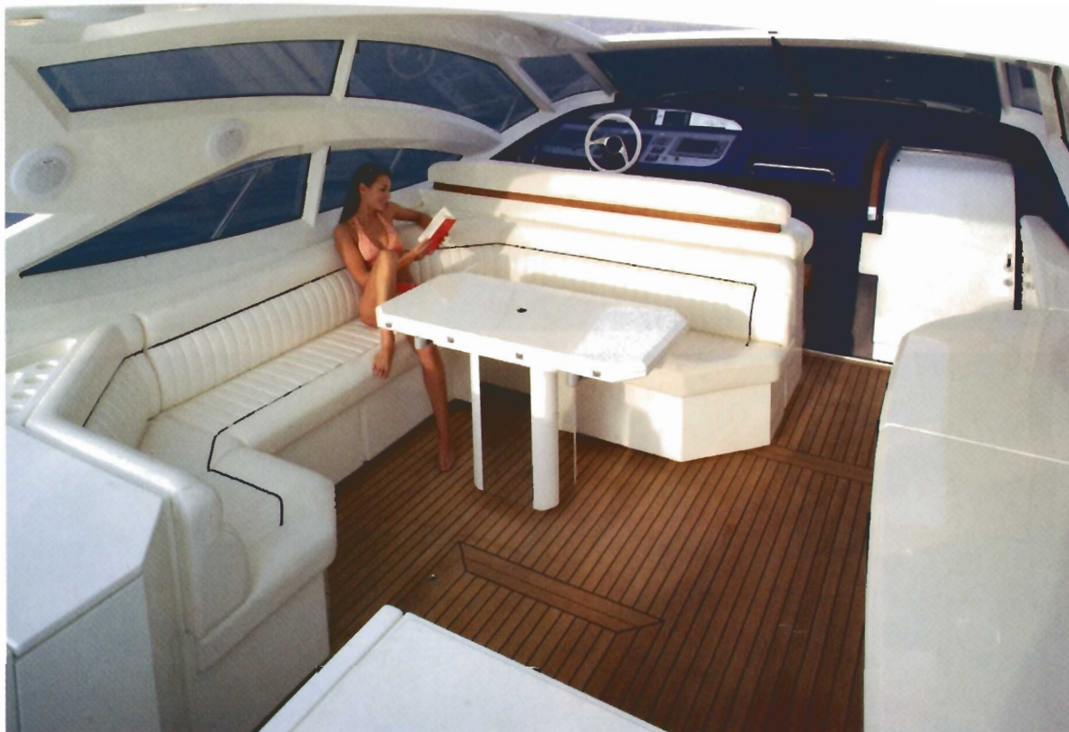
Una gran mesa desplegable permite acomodar hasta 10 personas al aire libre.

los que se ha decorado el barco, con una extensa gama de materiales exclusivos entre los que el armador puede escoger para que el resultado sea a su gusto.