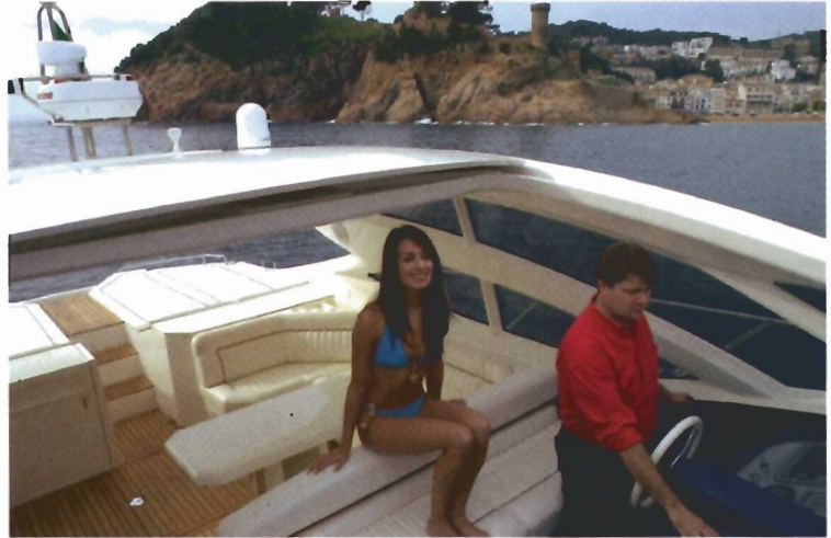
La espaciosa bañera, con sus dos ambientes bien diferenciados queda totalmente abierta gracias al techo rígido deslizante.