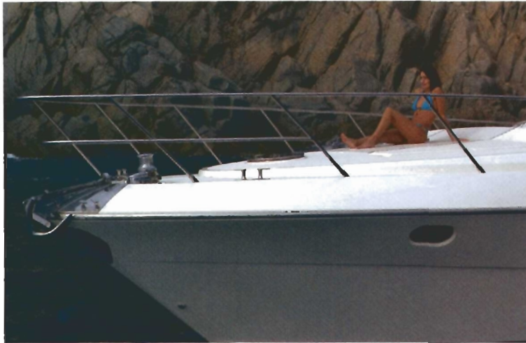
La proa se dota de un espacioso y bien protegido solárium.