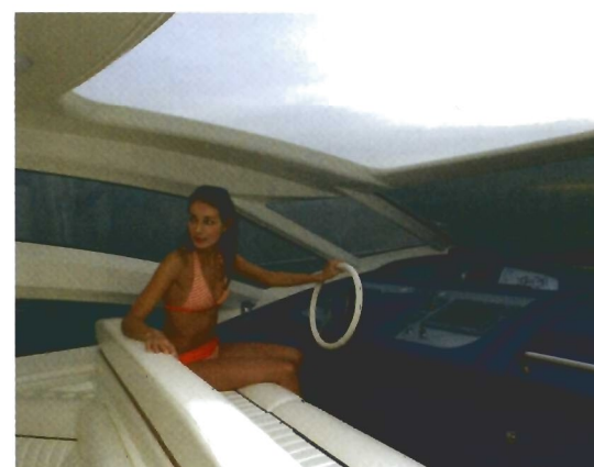
El puesto de gobierno es sobrio a la vez que confortable y excelentemente equipado.

Armonía de líneas, equilibrada distribución del espacio y un completísimo equipamiento, son los tres pilares sobre los que se asienta el Sarnico 60.