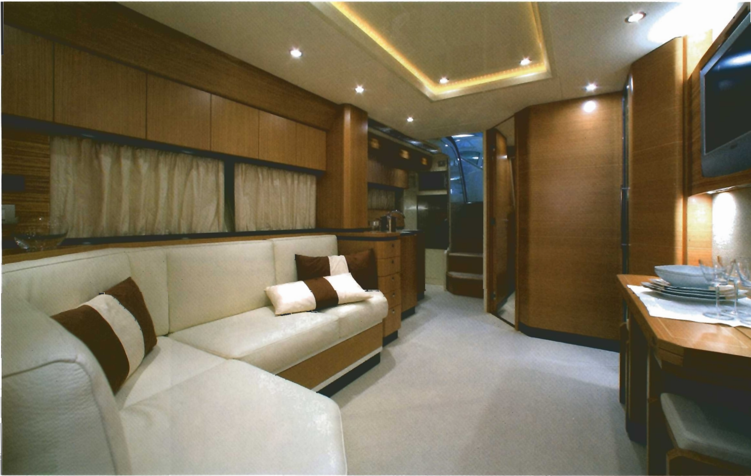
El espacio interior principal está ocupado por el salón-dinette acabado en tonos relajantes y materiales cálidos.