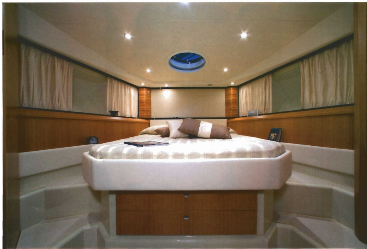
El camarote de proa, con cama doble exenta y plan a dos niveles, se extiende a toda la manga.

rincones con distribuciones abigarradas y absurdas concesiones a las modas pasajeras. Por ello, aunque en una 60 pies se pueden obtener fácilmente tres o cuatro cabinas, en esta eslora Sarnico ha querido mostrar que el lujo debe estar acorde con el confort.