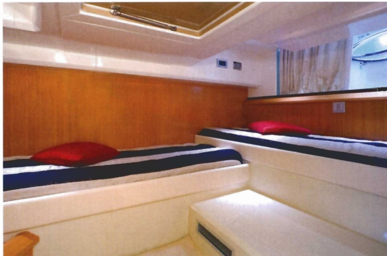
■ Gostima je namijenjena manja, ali ne i manje udobna kabina s 'ukrštenim' posteljama

stropna prozorska okna i garderobni ormarići. I ta je kabina opremljena vlastitim sanitarnim čvorom. Svi prostori interijera uz inovativna rješenja obiluju prostorom, dok im obilje kvalitetnoga drva - u estetskom kontrastu s modernim materijalima - daje zaista plemenit izgled. Vanjski salon natkriven je krovčićem na