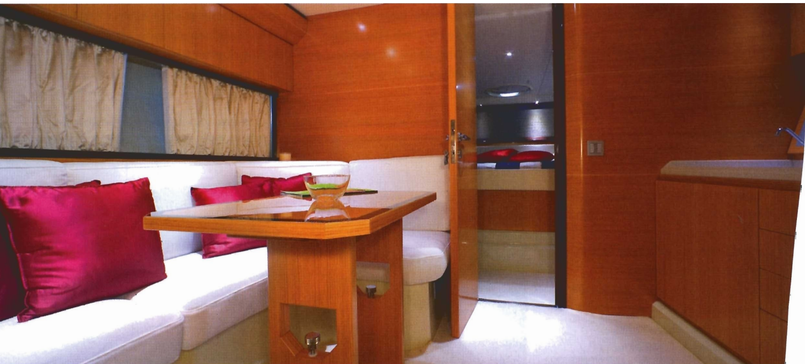
■ Interijer Sarnicova ljepotana doslovce otima dah... do kojega nije potom lako doći!

- zaobljenih bokova i pomalo uvučene ograde koja podupire stube prema kokpitu - a tamo su i elektrohidraulična vrata krmnoga spremišta koje se prostire čitavom širinom trupa, te može primiti pomoćno plovilo i mnogo opreme. Spider mogu pokretati četiri različita sustava Volvo IPS, s motorima snage od 260 do 435