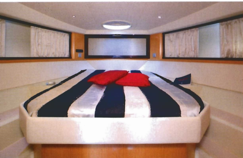
■ Nije samo za jurnjavu morem, nego i za popodnevni ili noćni odmor u punoj udobnosti: Spider pod pramčanom palubom krije pravu bračnu ložnicu