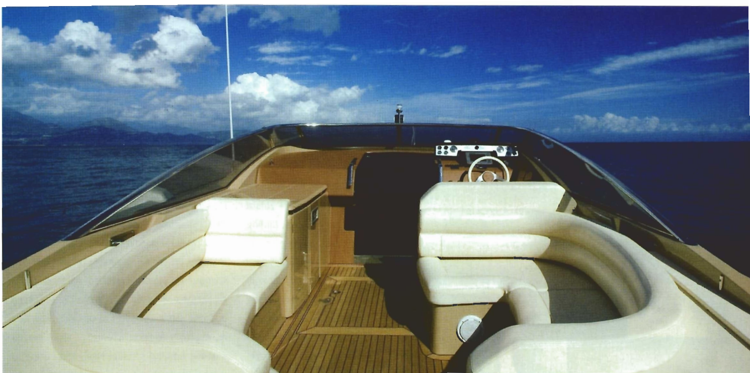
■ Kokpit udobnosti i estetskih dosega otmjenog salona daje 'pauku' nešto od elegancije legendarnih limuzina

KS, što će zadovoljiti potrebu za brzinom i onih koji vole 'divljati' po moru. Zanimljivo da je kuća Sarnico naručila projekt korita zasebno, od studija Victory Design, poznatog po golemom iskustvu u stvaranju izvanredno brzih brodova vrhunskih pomorstvenih svojstava, pa je Spider pouzdan, brz i savršeno udoban pri svim brzinama. I u gradnji korita, palube i nadgrada angažirana je pouzdana partnerska kuća - Besozzi Selveti - dok je brod finaliziran u 'škveru' Sarnico. Valja spomenuti da takva podjela posla među specijaliziranim tvrtkama nije neuobičajena u vrhunskoj nautičkoj proizvodnji,