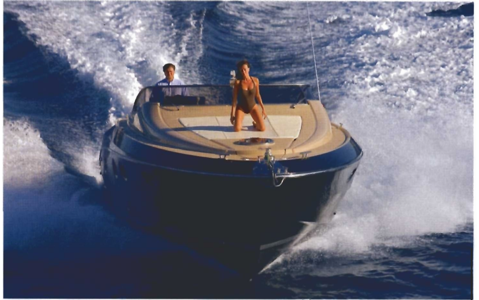
Sportske linije čine Sarnicovu prinovu osobito privlačnom mladim i dinamičnoj 'konzumaciji' mora sklonim nautičarima

N ovi Sarnico Spider, premijerno predstavljen na ovogodišnjem sajmu u Cannesu, utjelovljenje je otmjenosti i sportskoga duha. Njegove zamamne linije djelo su studija Nuvolari&Lenard, a spajaju klasičnu ljepotu i moderne trendove, dok se izborom boja i materijala ta krasna jahta može u potpunosti prilagoditi ukusu naručitelja. Osim toga, različitim se kombinacijama boja i odabirom dodatne opreme taj brod zamjetno izdiže iznad svoje klase i stereotipnih rješenja. Sarnico Spider ima nizak profil koji mu daje naglašeno sportski izgled, a funkcionalno srce te jahte - u smislu prikladnosti za udoban boravak - je kokpit, u koji se lako ulazi iz blagovaonice, kroz klizna vrata, i koji je svojevrsna