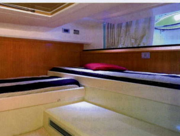
Boven en midden: Kombuis en natte cel. Onder: Gastenhut

len vinden in Zuid-Europa. Daar zal de tent in de praktijk voornamelijk worden gebruikt als voorziening om de boot in de haven te beschermen tegen weer en wind.