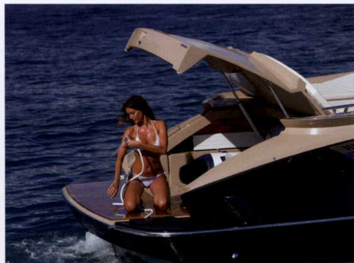
OFICER WACHTOWY PODCZAS CODZIENNEJ ABLUCJI