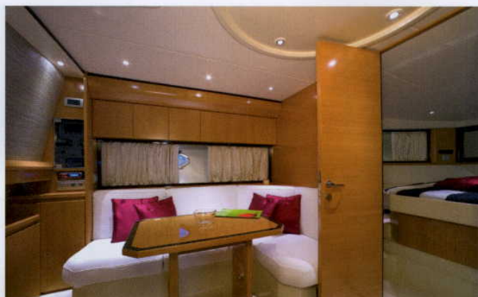
CIEPŁO OŚWIETLONE WNĘTRZE