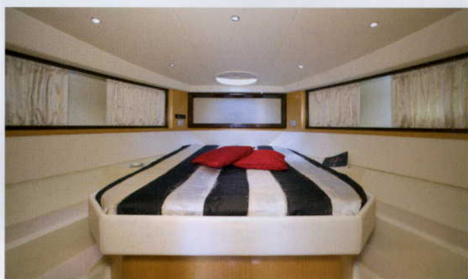
OPERACYJNE CENTRUM DOWODZENIA