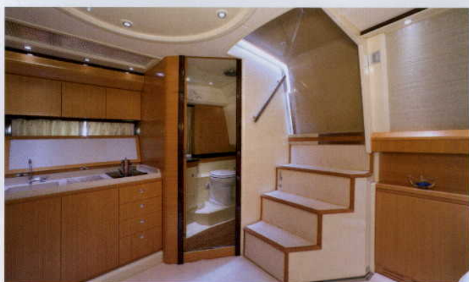
DOBRY SMAK POD POKŁADEM BUDUJE TEŻ KLIMAT