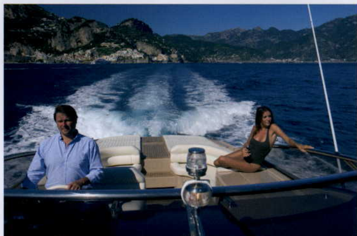
...I SPOKOJNY POWRÓT