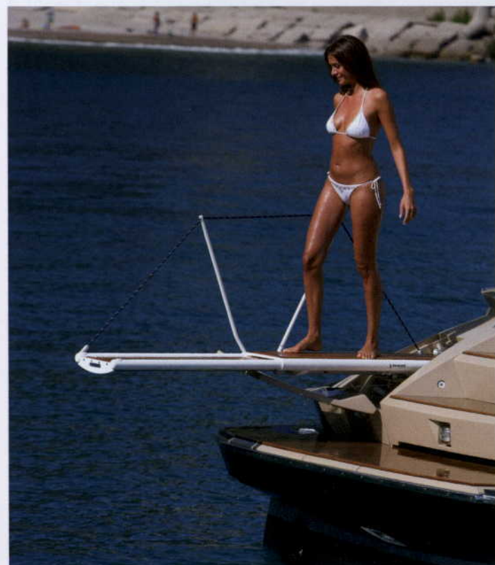
NA TAKIM JACHCIE TRAP JEST JUŻ NIEZBĘDNY. ALE ZASTOSOWANIA MOGĄ BYĆ ZRÓŻNICOWANE