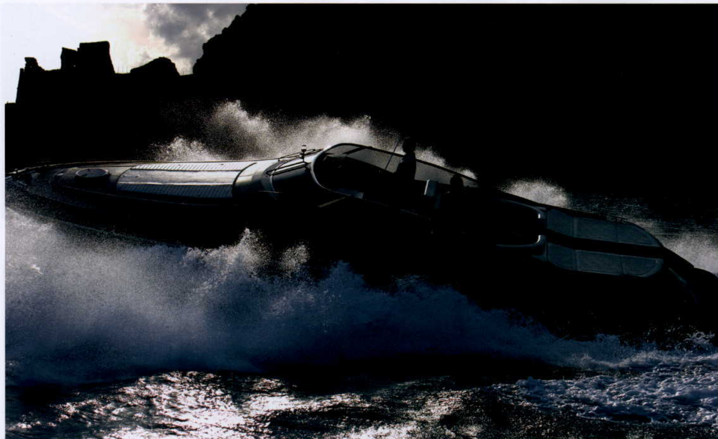
REJS Z ADRENALINĄ...

Podobno pierwszy Spider niebawem w kraju