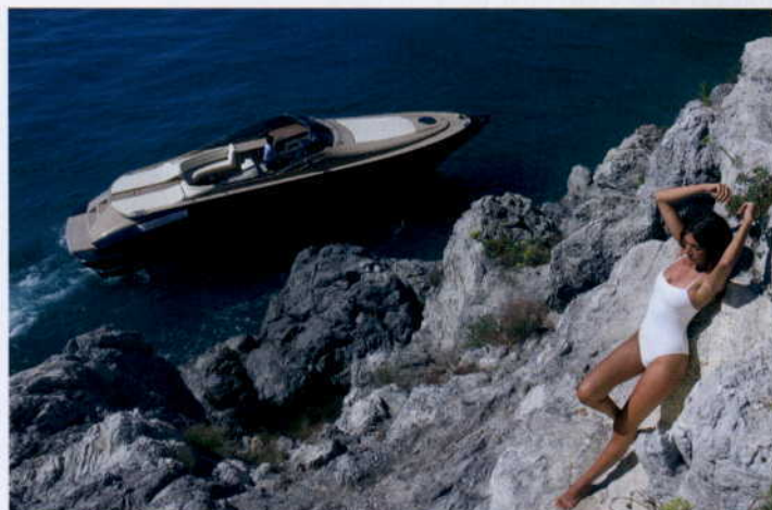
...POTEM CHWILA RELAKSU...