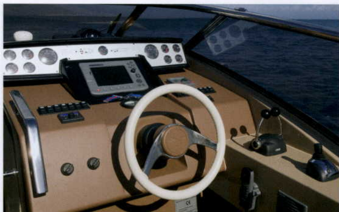
CIEKAWY KONTRAST DAJE TO KÓŁKO

Wybrana moc silnika pozwala na wiele szaleństw