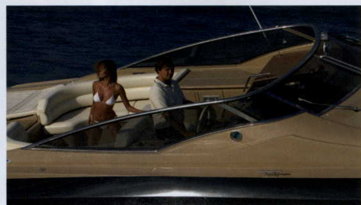
WYGODNA JEDNOSTKA DLA DWOJGA