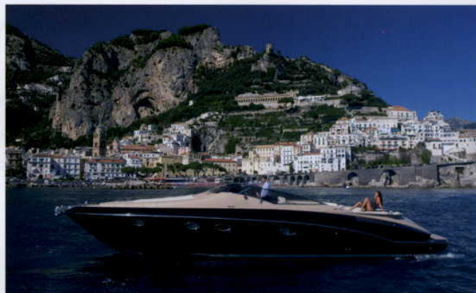
W ZACISZU ZATOKI MASSIMO I KAMELA CZEKAJĄ NA PRZYJACIÓŁ

wyrafinowane kanty. Długi, wąski dziób i szerokie matrace przeznaczone do kąpeli słonecznych, funkcjonalność kokpitu, ze szczególną uwagą poświęconą ergonomii fotela sternika, to znaki rozpoznawcze Cantieri di Sarnico – bez potrzeby kompromisu nawet w tym wydaniu. Dlatego nad projektem, liniami pokładu i inżynierską formą czuwały aż trzy osobne studia. A jeśli mowa o technice wodnej, to Spider emanuje mocą nawet 740 KM z 2 wysokoprężnych Volvo Penta IPS, sprzężonych z uznaną za numer 1 w Powerboat P1 transmisją Flexidrive. I na koniec drobna uwaga: Spider Cantieri przyjmuje na pokład do 10 osób, a F 430 – 2, ale, jak wiadomo, punkt widzenia zależy od punktu siedzenia. ■