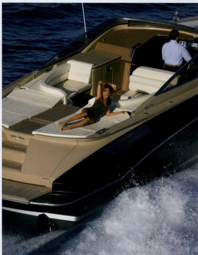
NIE ZABRAKNIE MIEJSCA DO KĄPIELI SŁONECZNYCH